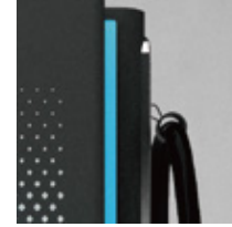
케이블 매니지먼트 스프링 밸런스