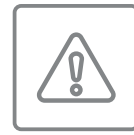
다양한 안전 기능 내장