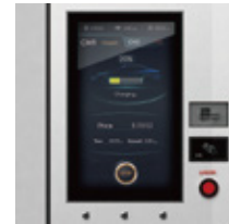
편리한 조작 24인치 정전식 터치패널 기계식 버튼