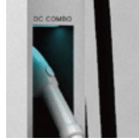
사용자 우선 건함 내부 UVC LED (살균기능)