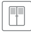
파워뱅크 별도 설치